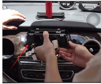
20. Die ursprüngliche Fahrzeughalterung anbringen