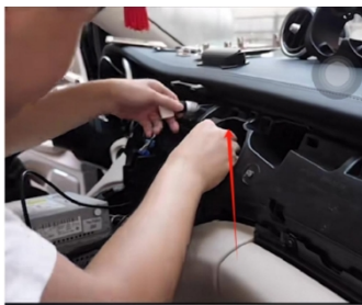
14. Führen Sie das neue Kabel ein