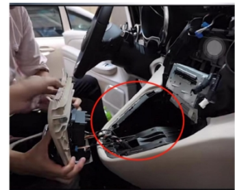
12. Entfernen Sie die Zierblende des