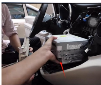
13. Entfernen Sie den Host