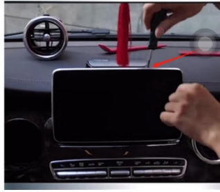
2. Entfernen Sie die Schraube hinter dem Bildschirm