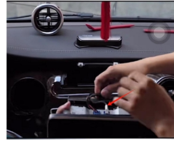
3. Entfernen Sie den Bildschirm und entfernen Sie den Stecker hinter dem Bildschirm