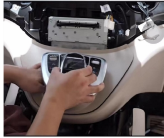
17. Installieren Sie den die Zierblende