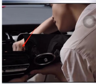
5. Entfernen Sie den Stecker hinter der Blende