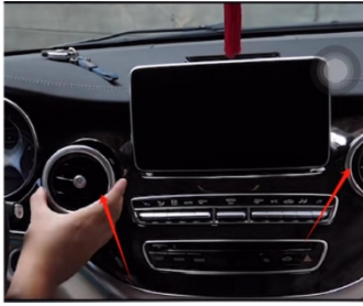
1. Entfernen Sie die beiden Lüftungsöffnungen.