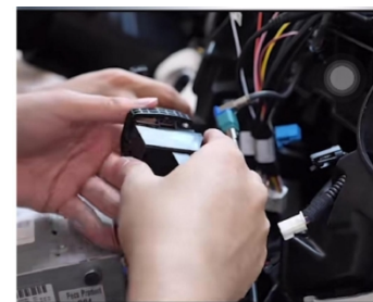
15. Installieren Sie neue Stromkabel und LVDS-Kabel