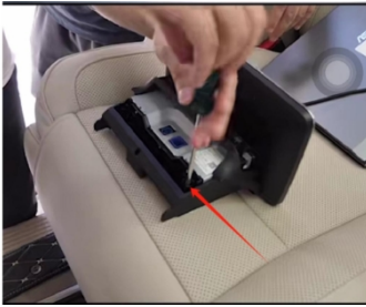
19. Entfernen Sie die originale Fahrzeughalterung