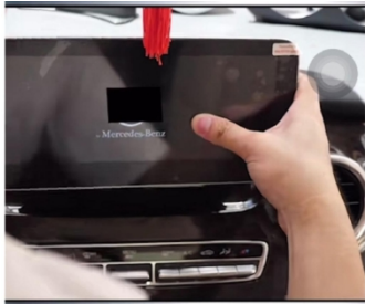
22. Installieren Sie den neuen Bildschirm