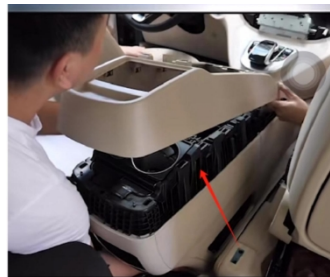
10. Öffnen Sie die Armlehnenbox. Knaufs.