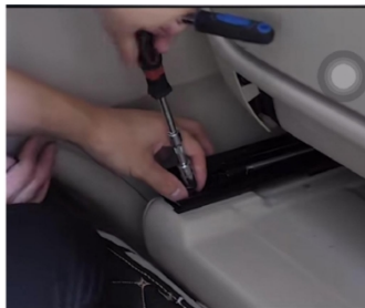
8. Entfernen Sie die beiden Schrauben hinter dem Beifahrersitz