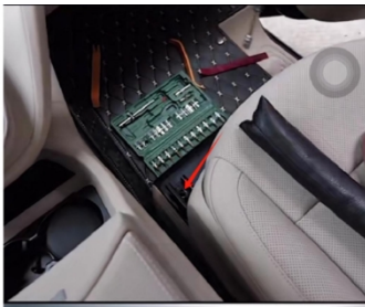
7. Entfernen Sie die beiden Schrauben vor dem Beifahrersitz