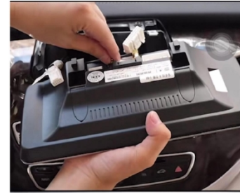
21. Alle Kabel ordnungsgemäß installieren